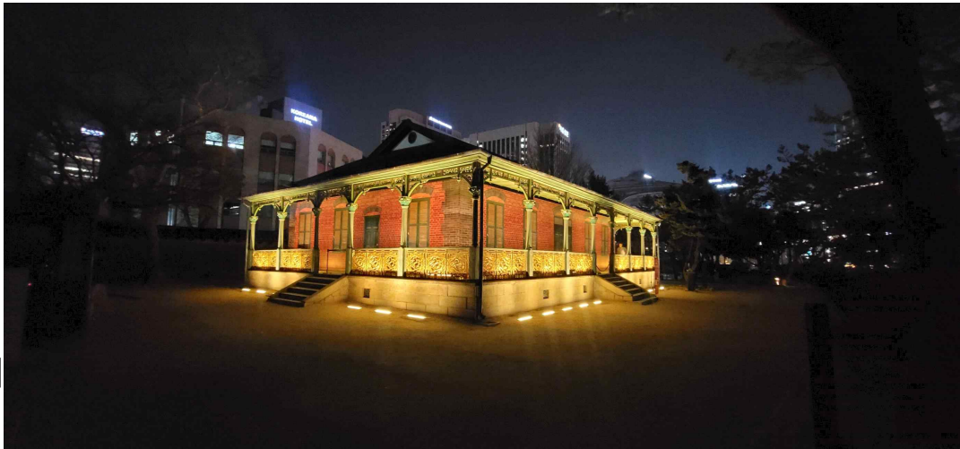
정관헌 현장 연출