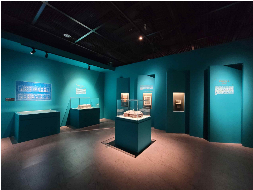
2-2. 세계를 맞이한 문