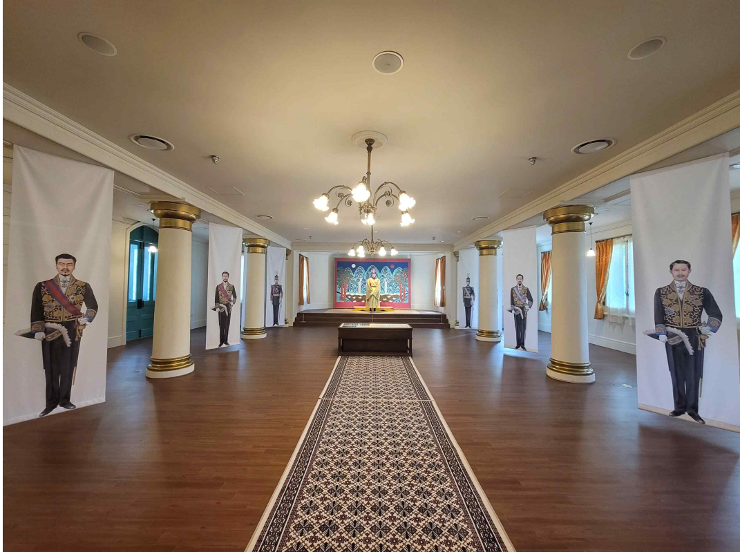
폐현실 현장 연출