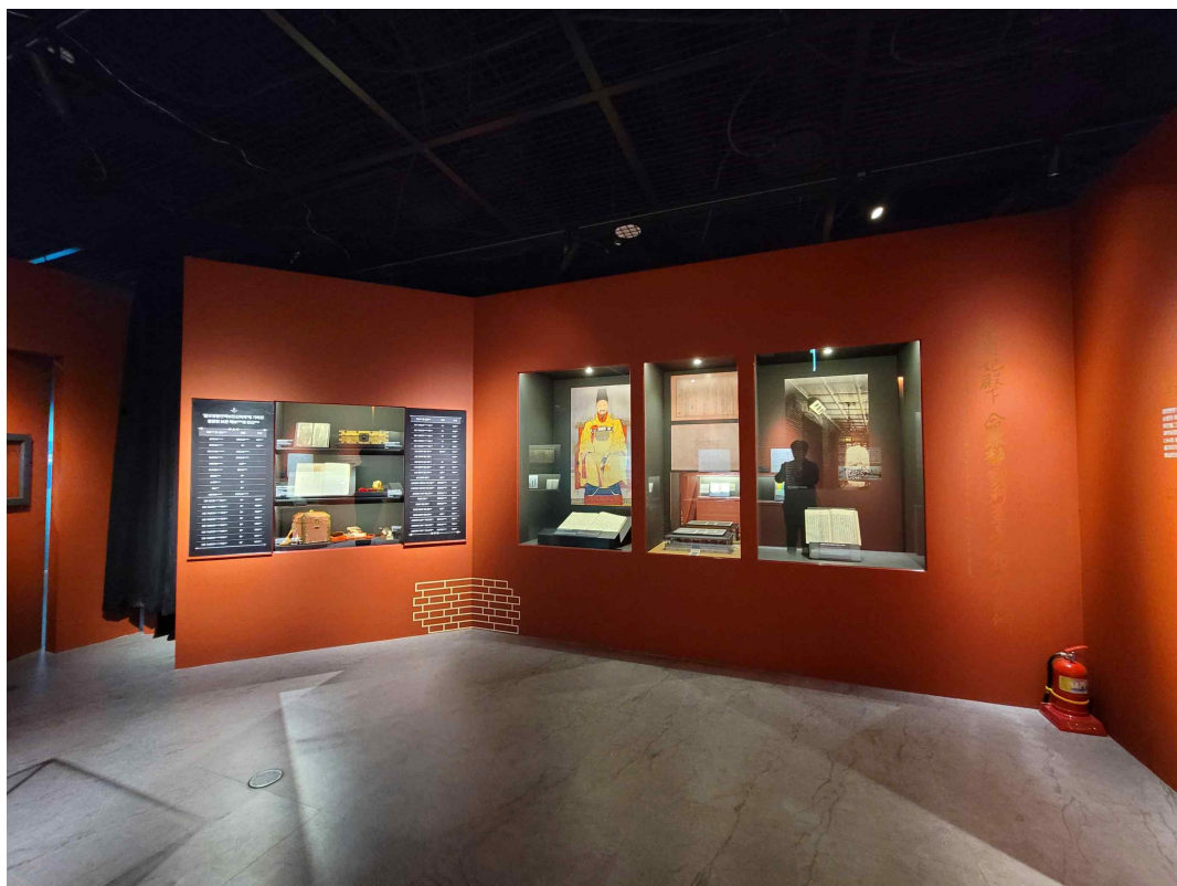
2-1. 전통을 지키는 벽