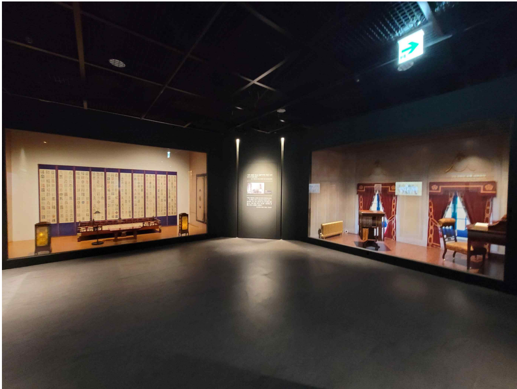
3. 변화한 황실 의례와 생활