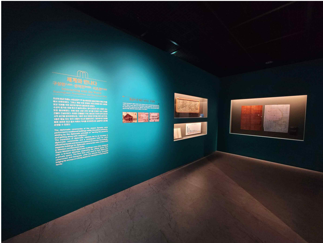
2-2. 세계를 맞이한 문