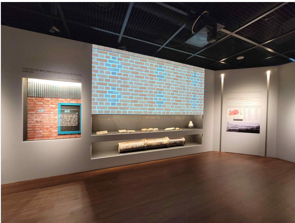
1. 새로운 건축 양관