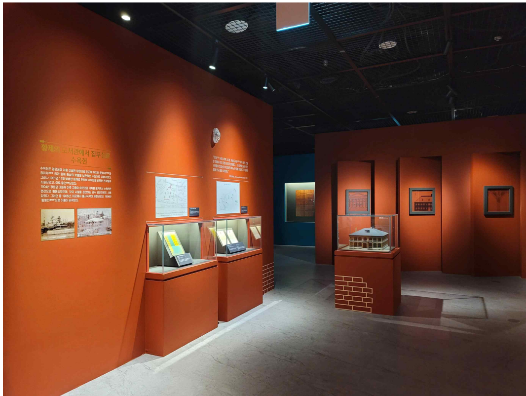
2-1. 전통을 지키는 벽